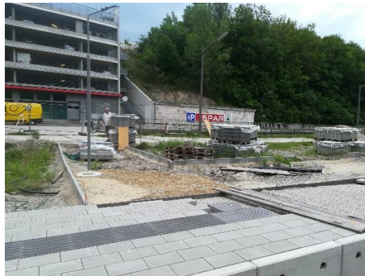
Der Bahnsteigzugang inkl. Blindenleitsystem