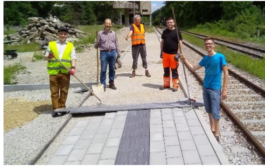
Das ehrenamtliche Team arbeitet derzeit an der Pflasterung inkl. Blindenleitsystem

Die folgenden Fotos finden Sie im Anhang und können gerne mit Namensnennung verwendet werden